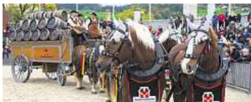
Feldschlösschen-Sechsspänner an der Olma.