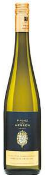
Winkeler Hasensprung Riesling Spätlese Weingut Prinz von Hessen