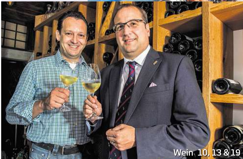
Wein 10, 13 & 19