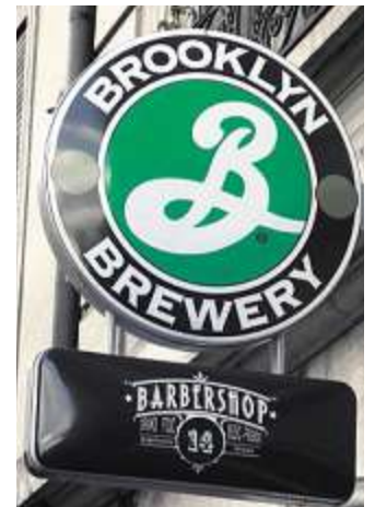
Der Brooklyn-Schriftzug über dem Eingang des «Barbershop».