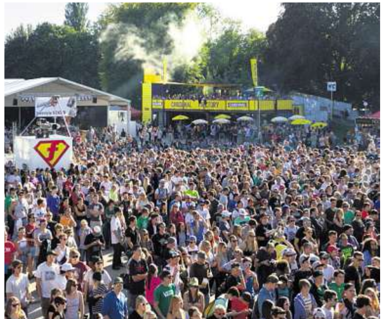
Cardinal ist bei freestyle.ch eine feste Grösse.