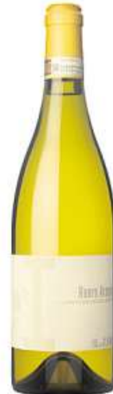
Roero Arneis La Brenta d'O