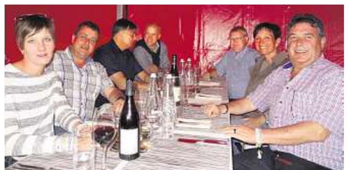
Feldschlösschen-Kunden in der neuen VIP-Lounge.