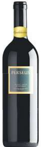
Perseus Pinot Noir Weingut Schmidheiny