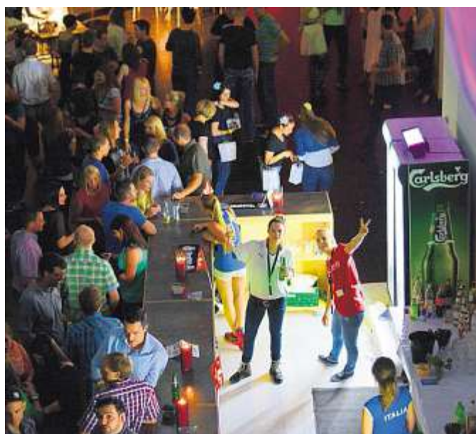
Partystimmung im Einkaufszentrum: Clubbing 23 in Chur.