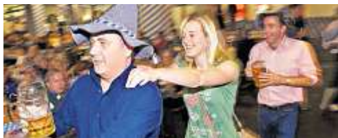
Wiesn-Gaudi in Basel.