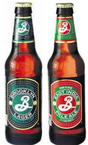
Die Gäste der Barbershop Bar lieben das Brooklyn Lager und das Brooklyn East India Pale Ale.