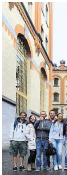
So lustig kann ein Besuch bei Feldschlösschen sein: Die Crew des zur Irish Pub Company gehörenden Paddy Reilly's Pub in Zürich geniesst den Tag in Rheinfelden.