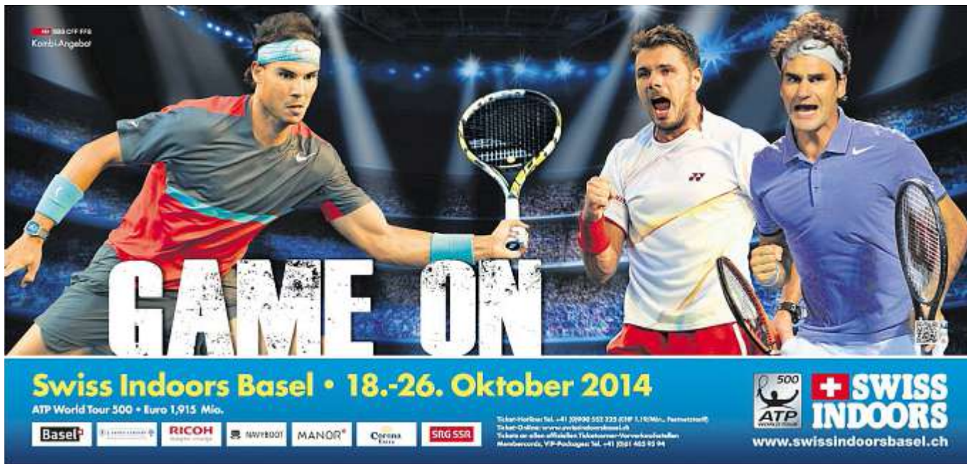
Rafael Nadal, Stanislas Wawrinka und Roger Federer (von links): offizielles Plakat der Swiss Indoors.