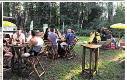
Lord Somersby und seine Helferinnen tourten mit dem Somersby-Bus durch die ganze Schweiz und veranstalteten unvergessliche Pop-up-Partys.

Auch wenn das Wetter in diesem Sommer zu wünschen übrig liess: Lord Somersby brachte mit den Events den Somersby-