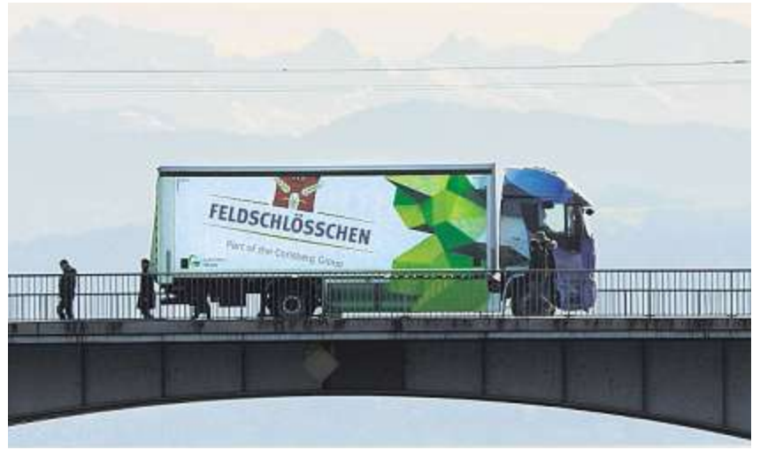
Leise und emissionsfreie Kundenbelieferung: Der Elektro-LKW von Feldschlösschen fährt mit Strom aus Wasserkraft.