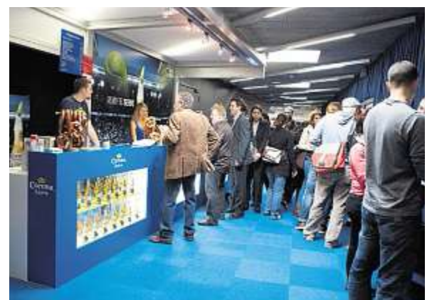
Die Corona Lounge und die Corona Bar sind an Tennisturnieren wie den Swiss Indoors ein beliebter Treffpunkt.