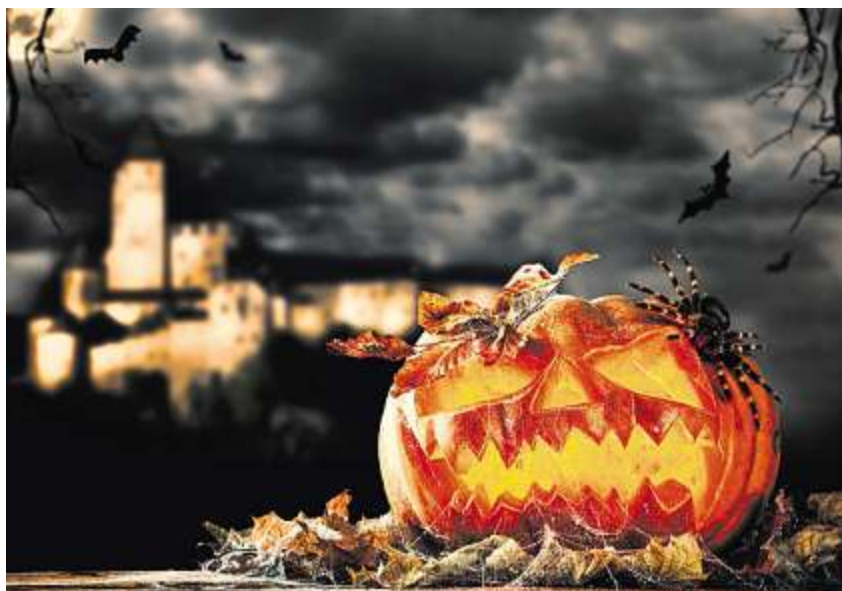
Ausgehöhlte Kürbisse mit einem Teelicht sorgen für richtige Halloween-Stimmung.