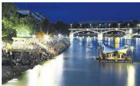
Einzigartige Kulisse: das Floss auf dem Rhein.

■ Tennis Swiss Open Gstaad: Der Schweizer Stanislas Wawrinka bekommt es im Berner Oberland mit