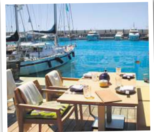
Auch die Aussengastronomie ist attraktiv.