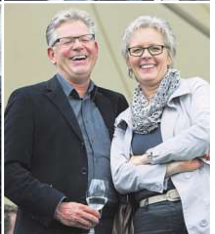
Trotz Regenwolken eitel Sonnenschein: Viele Kunden folgten der Einladung von Feldschlösschen auf die Pferderennbahn.