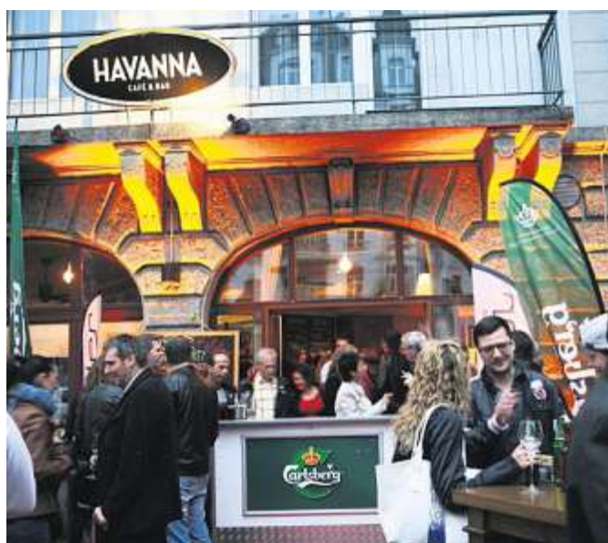
Das «Havanna» war Schauplatz der Zentralschweizer Barführerparty.