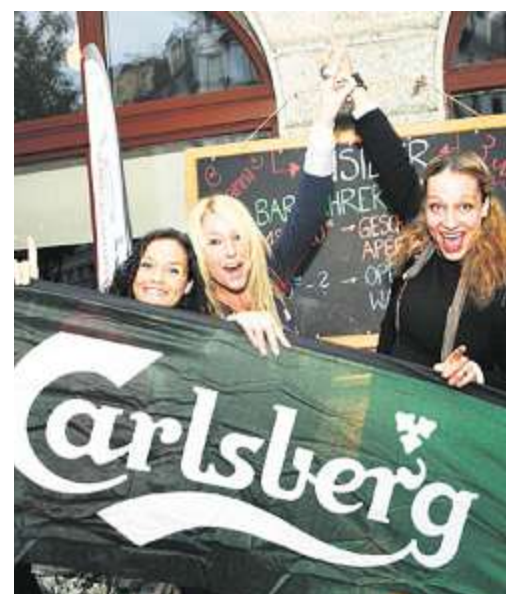
Die Partygirls von Hauptsponsor Carlsberg.