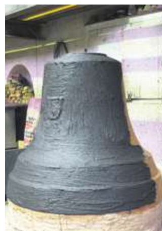
In dieser grauen Schicht steckt in Glocken das festigende Bier.

Welche enorm lange Lebensdauer ein Rüetschi-Produkt unter anderem dank des Bierklebers hat, beweist die Bronzeglocke in der Freiburger Kathedrale, die bereits seit 640 Jahren läutet.