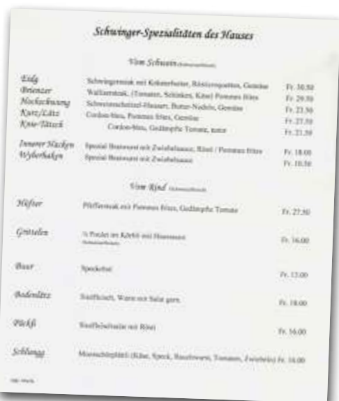
Die Karte mit den Schwinger-Spezialitäten.