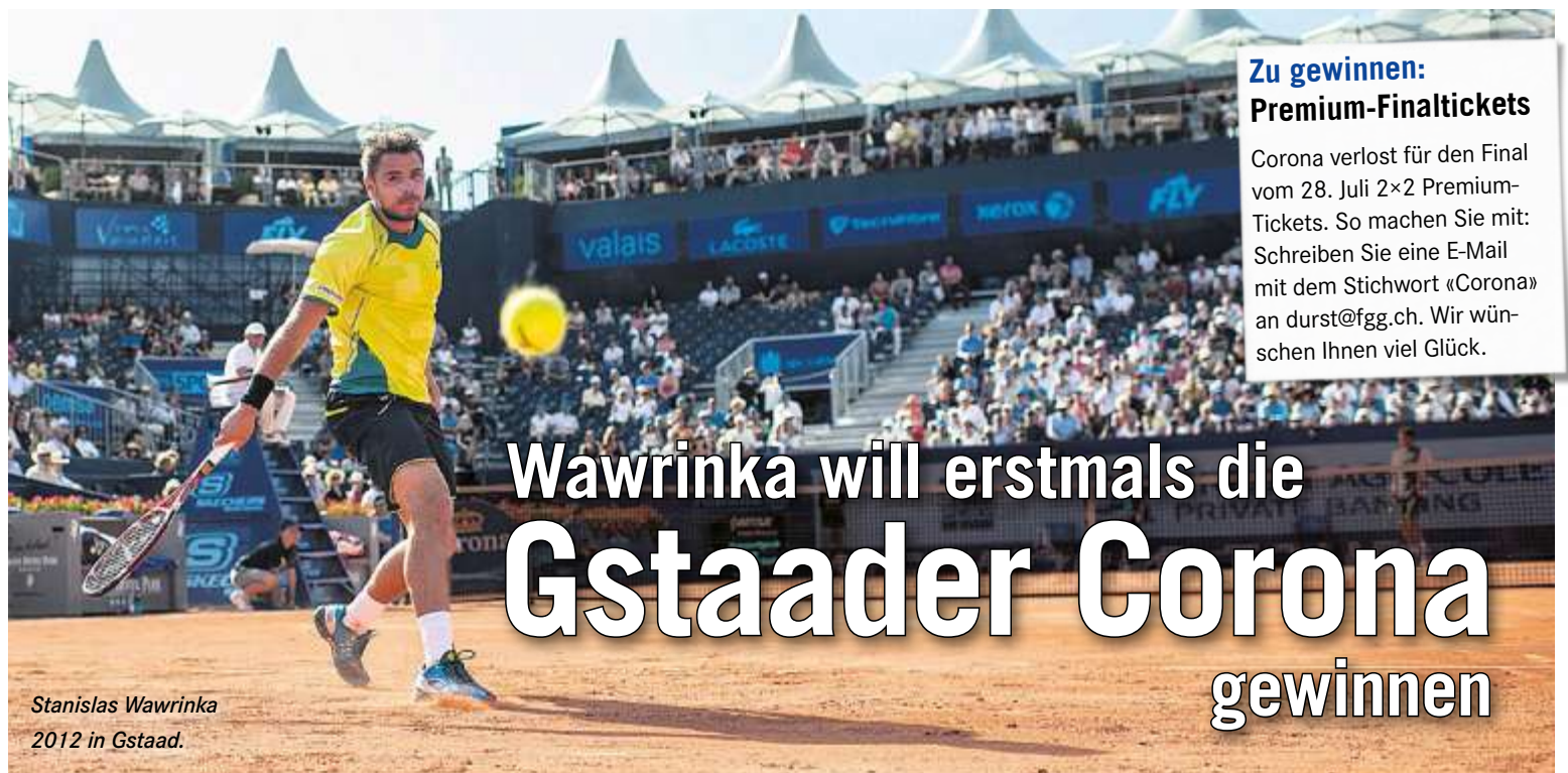
Stanislas Wawrinka 2012 in Gstaad.