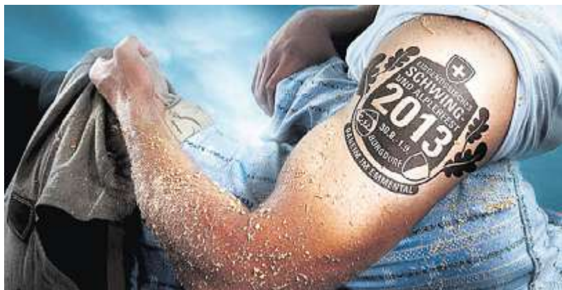
Bärenstark: offizielles Plakat des eidgenössischen Schwingfestes.