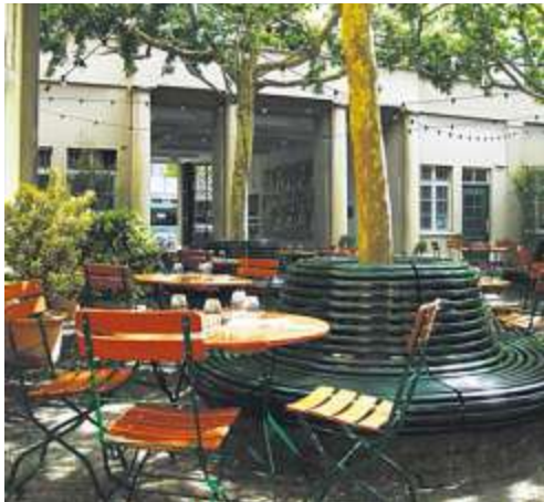
«Volkshaus» in Basel.