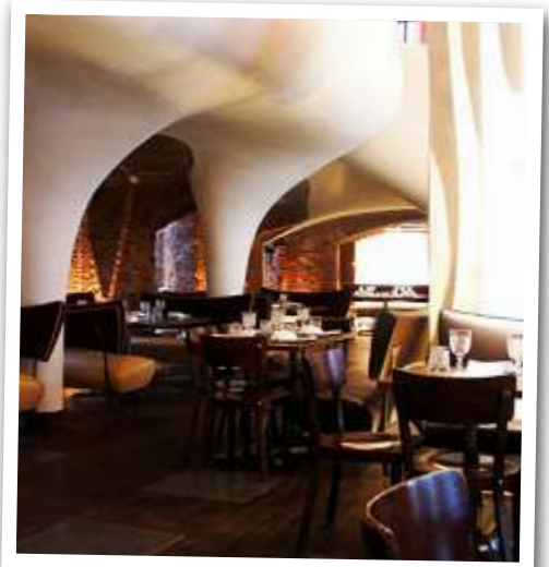
Das Restaurant zieht viele Gäste an.